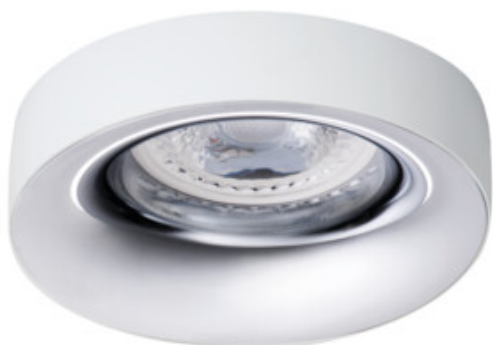
ELNIS L W/C