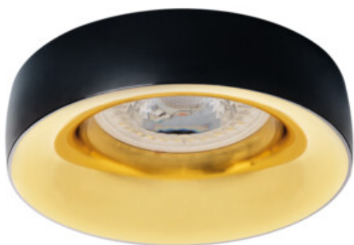
ELNIS L B/G