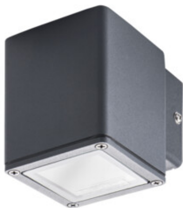
GORI EL 135 D