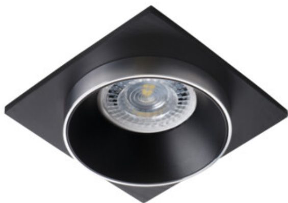
SIMEN DSL SR/B/B